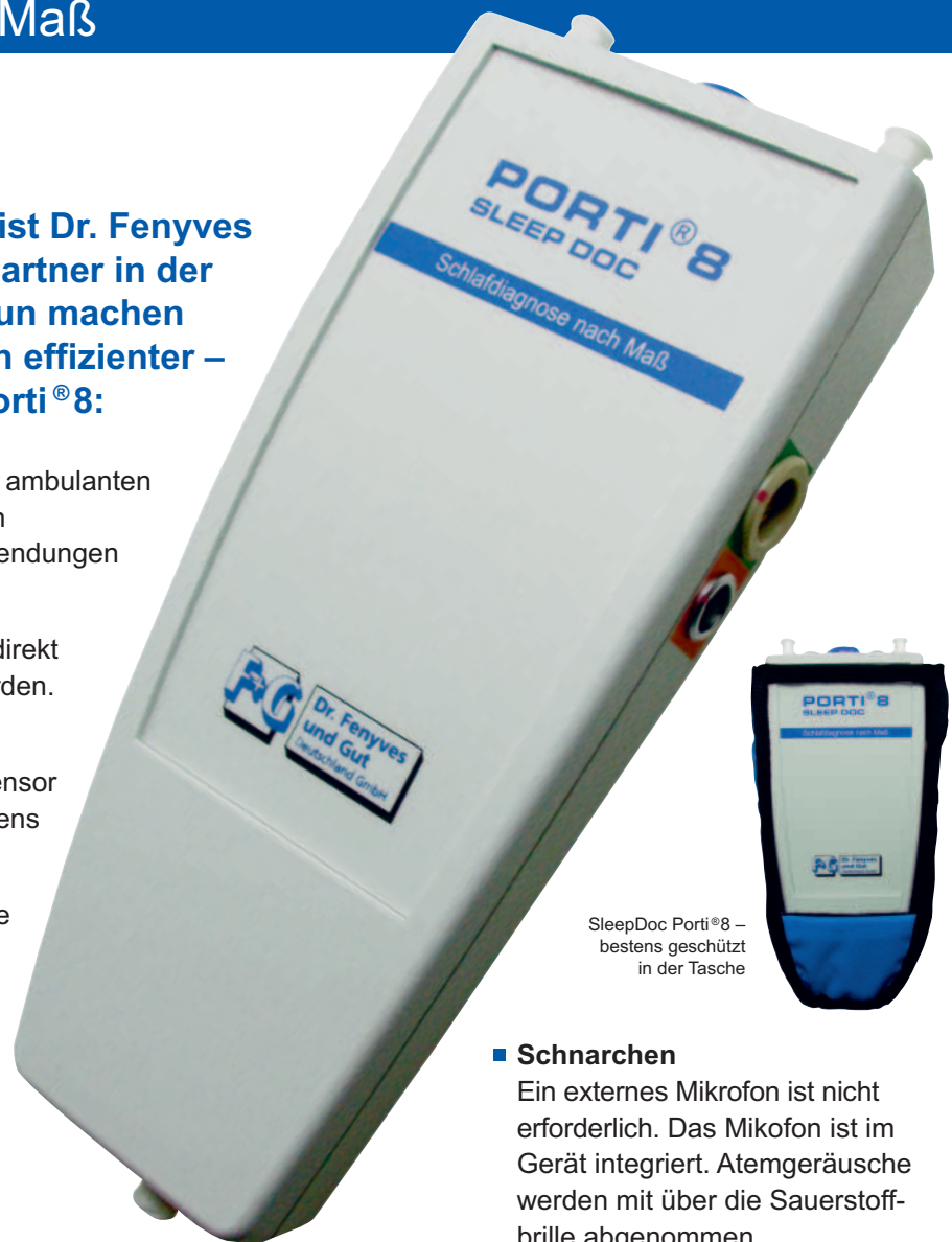
SleepDoc Porti® 8 – bestens geschützt in der Tasche