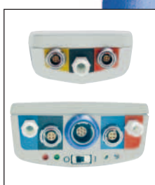
Eindeutige und robuste Anschlüsse.